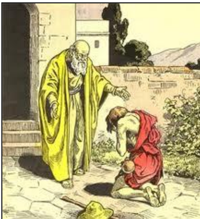
Le fils prodigue

Une certaine façon de vivre soi-même : une espérance en l'humain