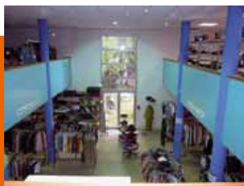
Magasin de vente