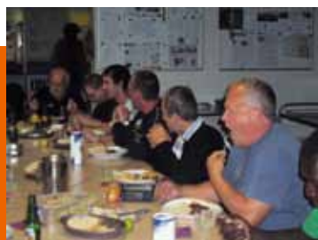
Repas fraternel au sein de la communauté

Emmaüs c'est avant tout un regard différent porté sur l'autre : il n'est pas le paumé, le coupable, le clochard ou l'exilé... mais un homme ou une femme riche de potentiel, qui a toute sa place dans la société. C'est pourquoi quiconque se présente à la porte d'une communauté est certain d'être accueilli, quel que soit son parcours.