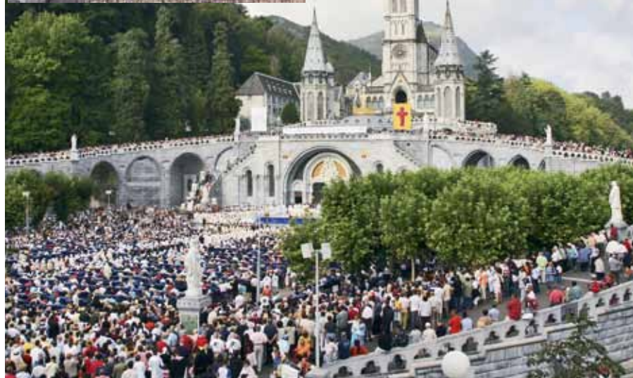
DR SANCTUAIRES ND DE LOURDES