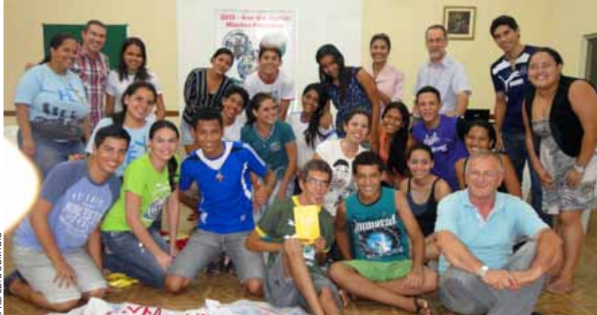
Voici l'équipe des jeunes de Porto Velho qui accueillera notre délégation pour la semaine missionnaire au Brésil.