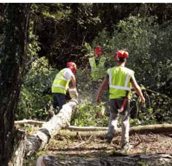
Chantier engagé par Terre d'emplois - Agate Paysages (Ounans, 39).

L' épargne salariale est une épargne que les salariés peuvent se constituer au sein de leur entreprise, avec l'aide de celle-ci.