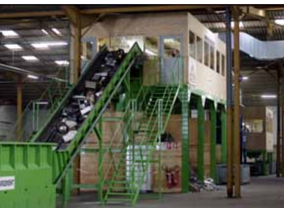
L'entreprise Juratri (Perrigny, 39) a inauguré en septembre 2012 sa plateforme de recyclage des déchets électriques et électroniques Trivolution.